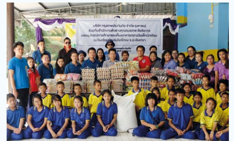
สำนักงานตัวแทนจังหวัดฉะเชิงเทรา

กรุงเทพประกันภัย ร่วมกับสำนักงานตัวแทน จังหวัดฉะเชิงเทรา นำพนักงานกรุงเทพประกันภัย และพนักงานของสำนักงานตัวแทนร่วมเลี้ยงอาหารกลางวันเด็กนักเรียน พร้อมมอบอุปกรณ์การศึกษา และอาหารแห้งให้แก่โรงเรียนบ้านร่มโพธิ์ทอง นอกจากนี้ ยังได้ร่วมกันปลูกต้นไม้และทำกิจกรรม นันทนาการ ณ โรงเรียนบ้านร่มโพธิ์ทอง อ.ท่าตะเกียบ จ.ฉะเชิงเทรา เมื่อวันที่ 25 กรกฎาคม 2558