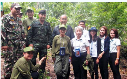
สำนักงานตัวแทนจังหวัดระนอง

กรุงเทพประกันภัย ร่วมกับสำนักงานตัวแทนจังหวัดระนอง นำพนักงานกรุงเทพประกันภัยและ พนักงานของสำนักงานตัวแทน ร่วมกิจกรรมปลูกป่าตามโครงการ “ฟื้นฟูป่าต้นน้ำเฉลิมพระเกียรติ” จัดโดยกรมกิจการพลเรือนทหารบก เพื่อฟื้นฟูระบบนิเวศและพัฒนาป่าต้นน้ำให้อุดมสมบูรณ์ ณ ป่าต้นน้ำบ้านเขาหยวก อ.เมือง จ.ระนอง เมื่อวันที่ 15 กรกฎาคม 2558