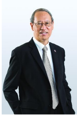
หม่อมราชวงศ์ศุภดิศ ดิศกุล